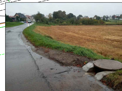
Fot. 9. Istniejący wpust deszczowy, przewidziana przebudowa i montaż separatora zanieczyszczeń stałych